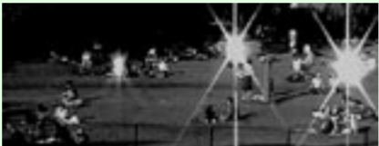
"Reflection" de Mariana Vassileva

Óptica es un inventario actual de actitudes, caracterizado por el eclecticismo necesario para entender el futuro. En este contexto, proponemos un modelo de investigación y difusión fundamentado en una revisión estructural de las nuevas corrientes audiovisuales a través de un proceso de exploración que implica la concepción de un espacio abierto.