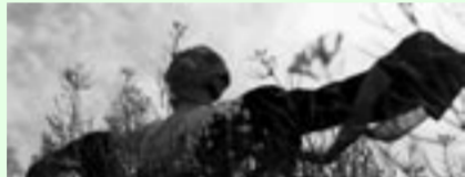
"Amor&Temor" de Carlos Cid Ruiz

Transitar el camino que conduce hacia la video-creación implica indagar por los senderos de la mirada. Una mirada que a lo largo de los años se ha transformado para dejarnos al descubierto su complicidad con la historia y su potencialidad discursiva traducida en imagen cultural. El mirar no es sólo un hábito que recorre aquello que está fuera de nosotros; sino que esta relación íntima con nuestro entorno responde también a un laboratorio interno. A la interioridad que se convierte en registro de una memoria colectiva en el acto de retratarnos "desde adentro", con nuestra realidad.