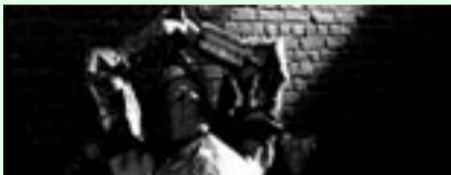
"Lancelot" de Jan Fabre

El desarrollo tecnológico y, en especial, el lanzamiento de los equipos de vídeo digital han dotado al artista contemporáneo de nuevas herramientas que le aproximan al formato audiovisual, con una libertad e inmediatez creativa sin antecedentes. Este fácil acceso ha propiciado nuevas formas de cinematografía de marcado carácter experimental.